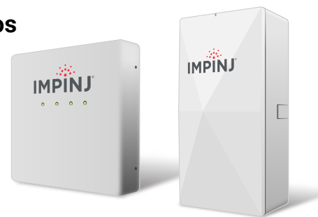
Impinj xArray y xSpan

Disponible en dos modelos—xSpan y xArray—Las puertas de enlace Impinj son sistemas de lectores RAIN RFID de infraestructura fija que simplifican el despliegue de aplicaciones que precisan una monitorización permanente. Las puertas de enlace Impinj emparejan un lector Impinj Speedway con antenas de diseñadas específicamente, que monitorizan los artículos etiquetados en un entorno. Diseñadas para aplicaciones a gran escala a nivel de artículo, las puertas de enlace Impinj proporcionan en tiempo real eventos de inteligencia de objeto.